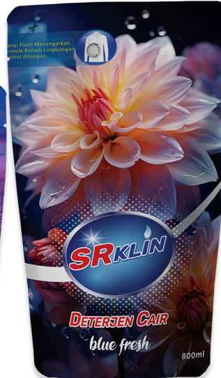
Deterjen Cair Blue Fresh 800ml, 1L, 5L