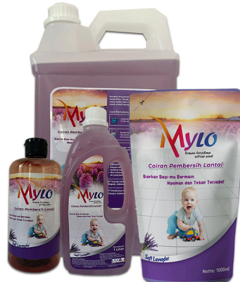
Mylo Pembersih Lantai Lavender 1000ml, 500ml, 250ml, 100ml 5L, 1L, 500ml Botol