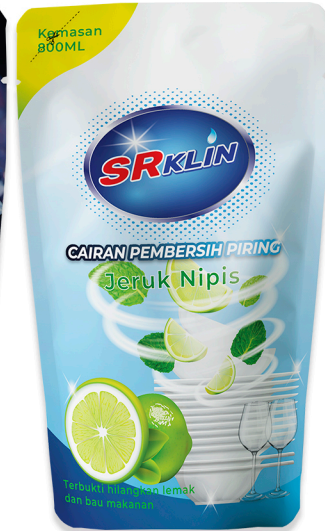
sabun Pencuci Piring Jeruk Nipis 800ml, 1L, 5L