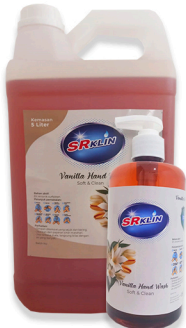
Hand Wash Vanilla 500ml, 5L