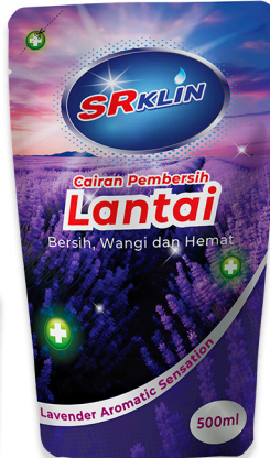
sabun Pembersih Lantai Lavender 500ml, 1L, 5L