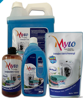
Mylo Deterjen Cair Blue Melody 1000ml, 500ml, 250ml, 100ml 5L, 1L, 500ml Botol