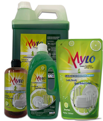
Mylo Pencuci Piring Jeruk Nipis 1000ml, 500ml, 250ml, 100ml 5L, 1L, 500ml Botol