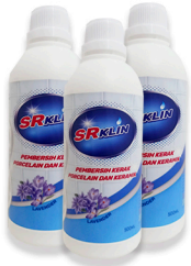
Pembersih Toilet/ Keramik Lavender 500ml, 1L